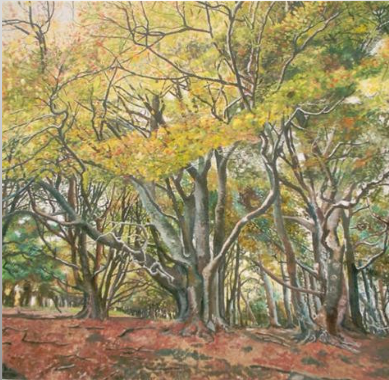
Fageda 100 x 100 óleo s/t.