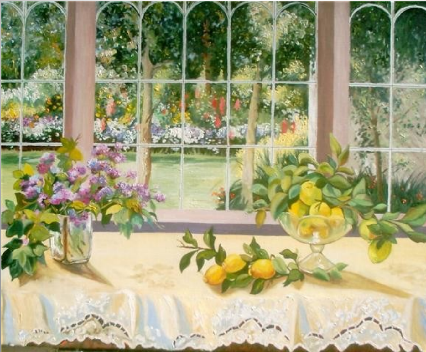
Interior amb vistes 81 x 65 óleo s/t.