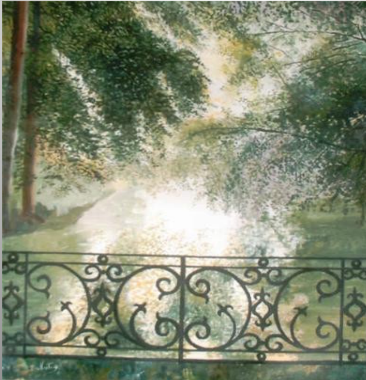
Pont de ferro 46 x 55 óleo s/t.