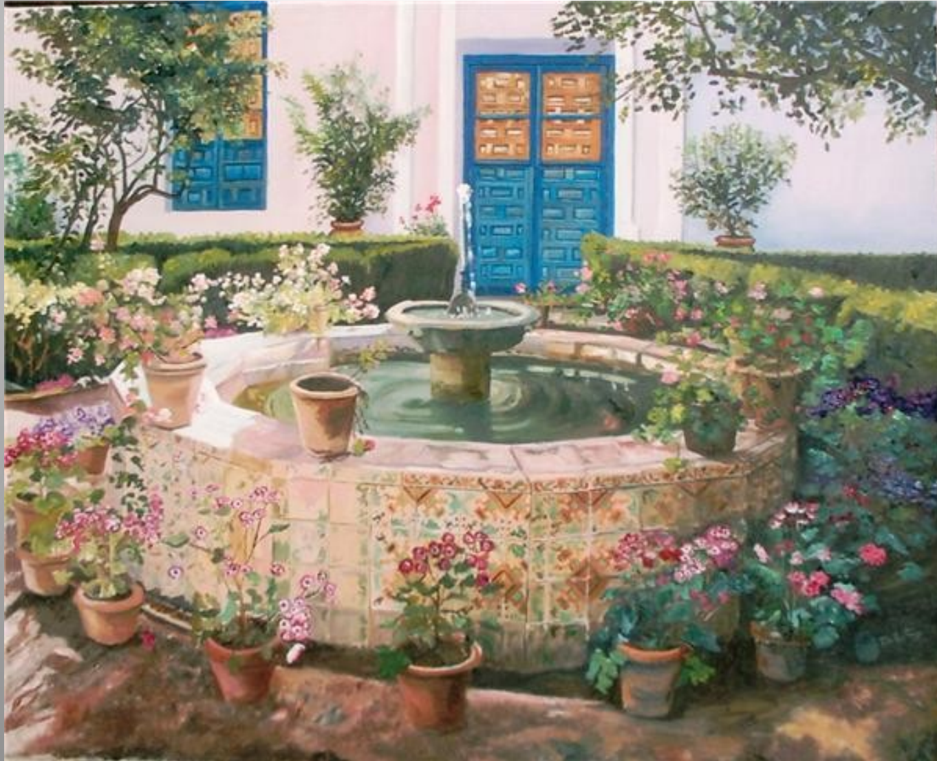
Patí de la madama 81 x 65 óleo s/t.