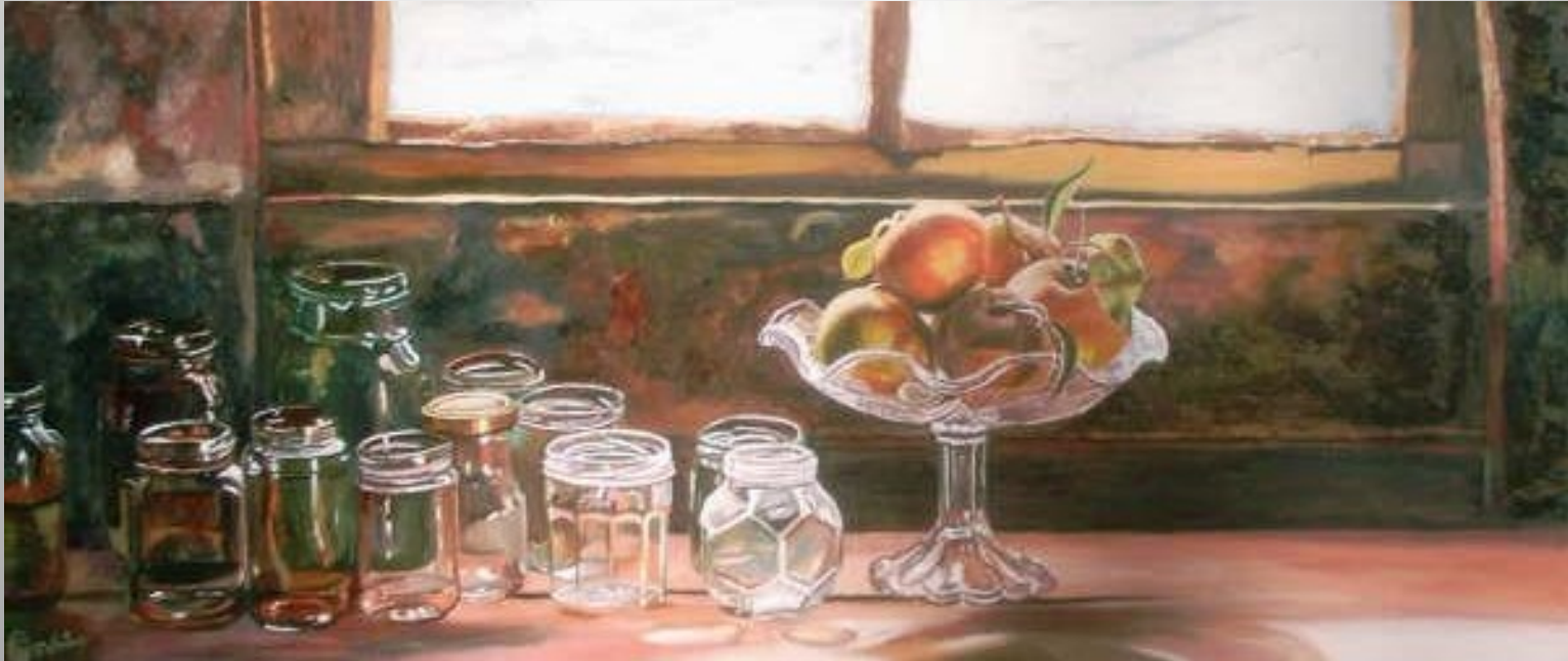
Flascons per a compota 116 x 50 óleo s/t.