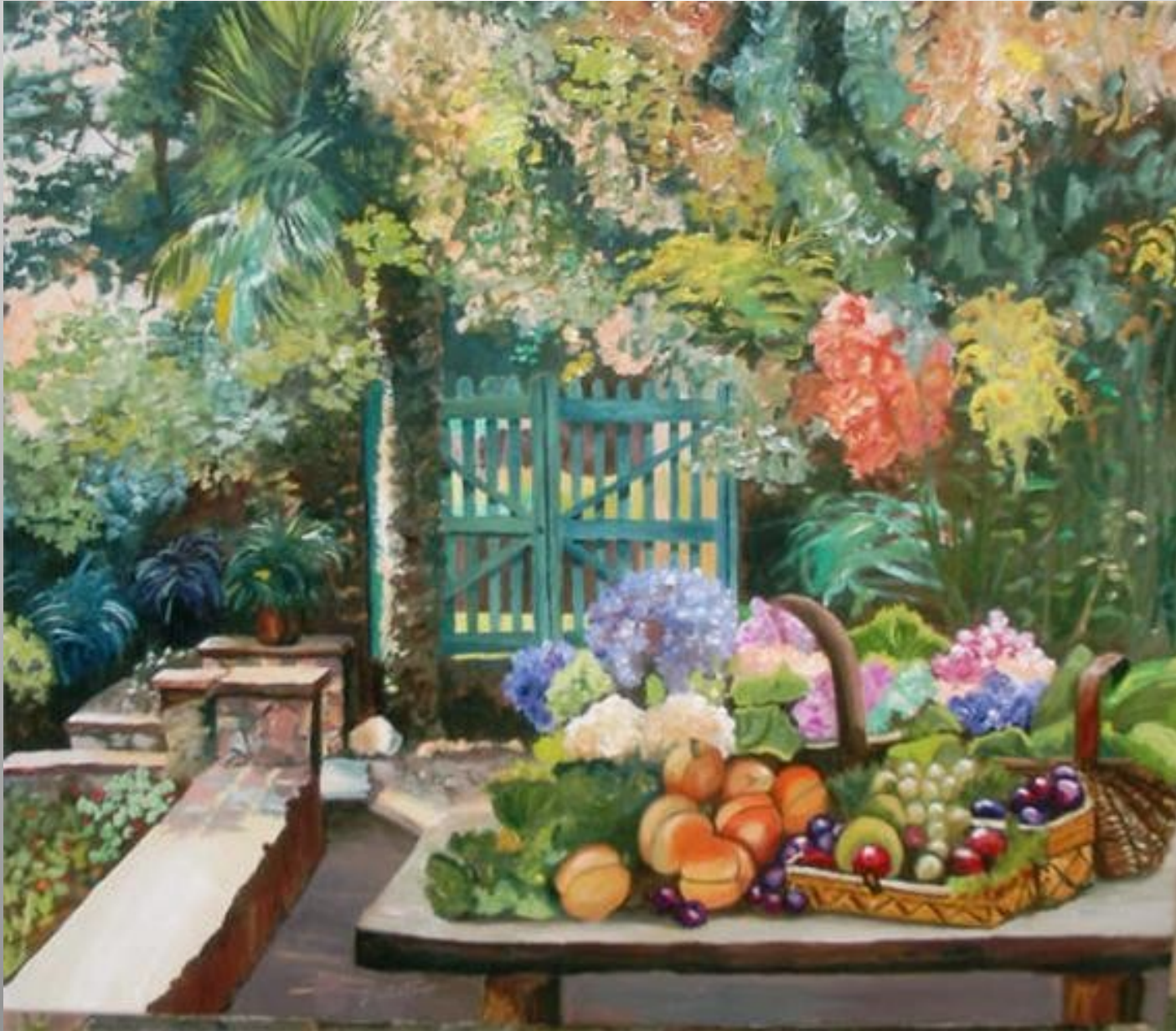
Jardí Botanic de Blanes 65 x 54 óleo s/t.