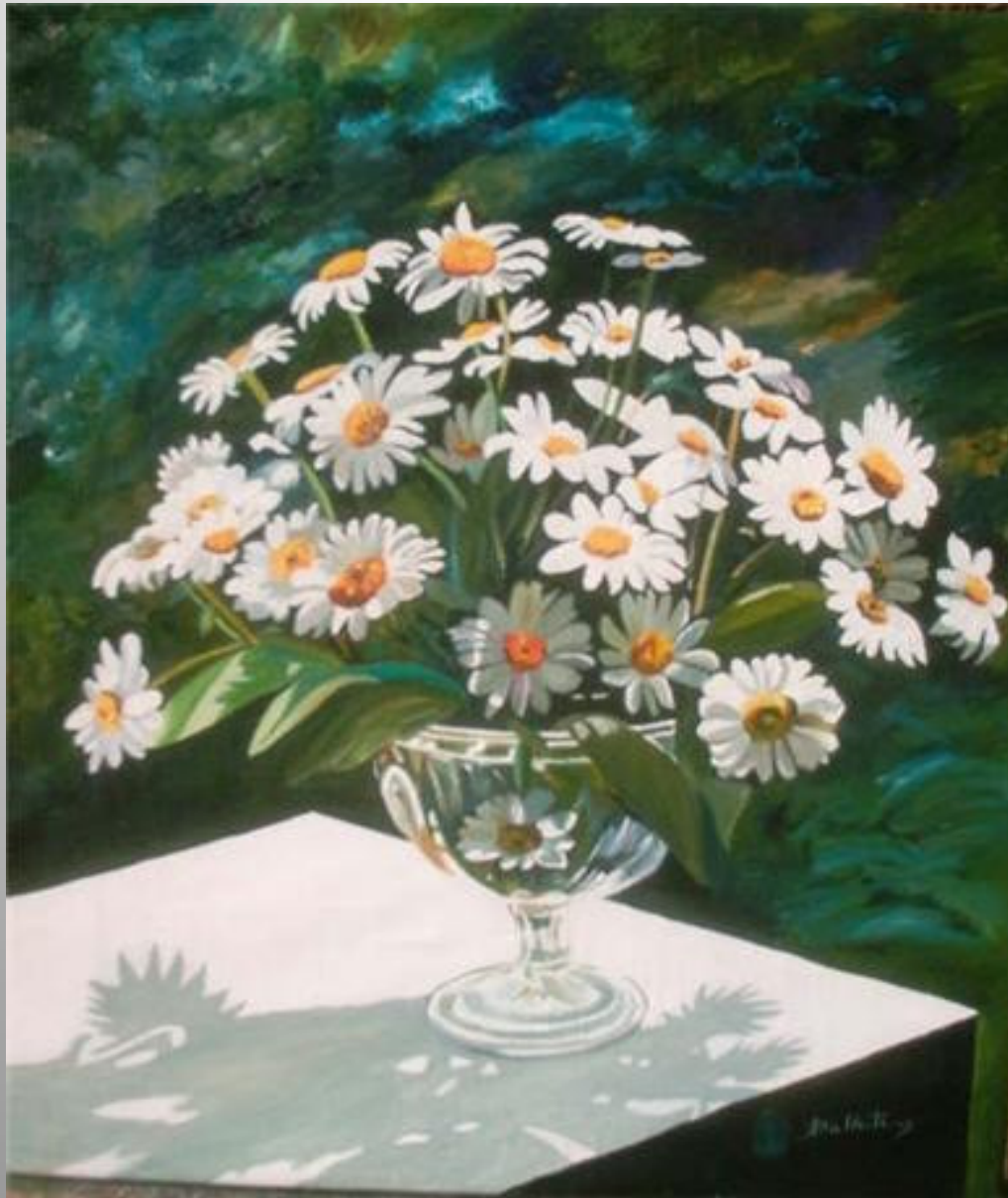
Margarites 46 x 55 óleo s/t.