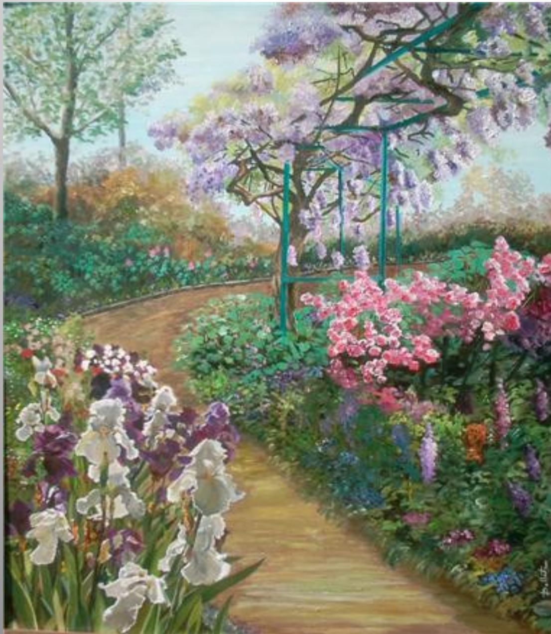
Iris 65 x 81 óleo s/t.