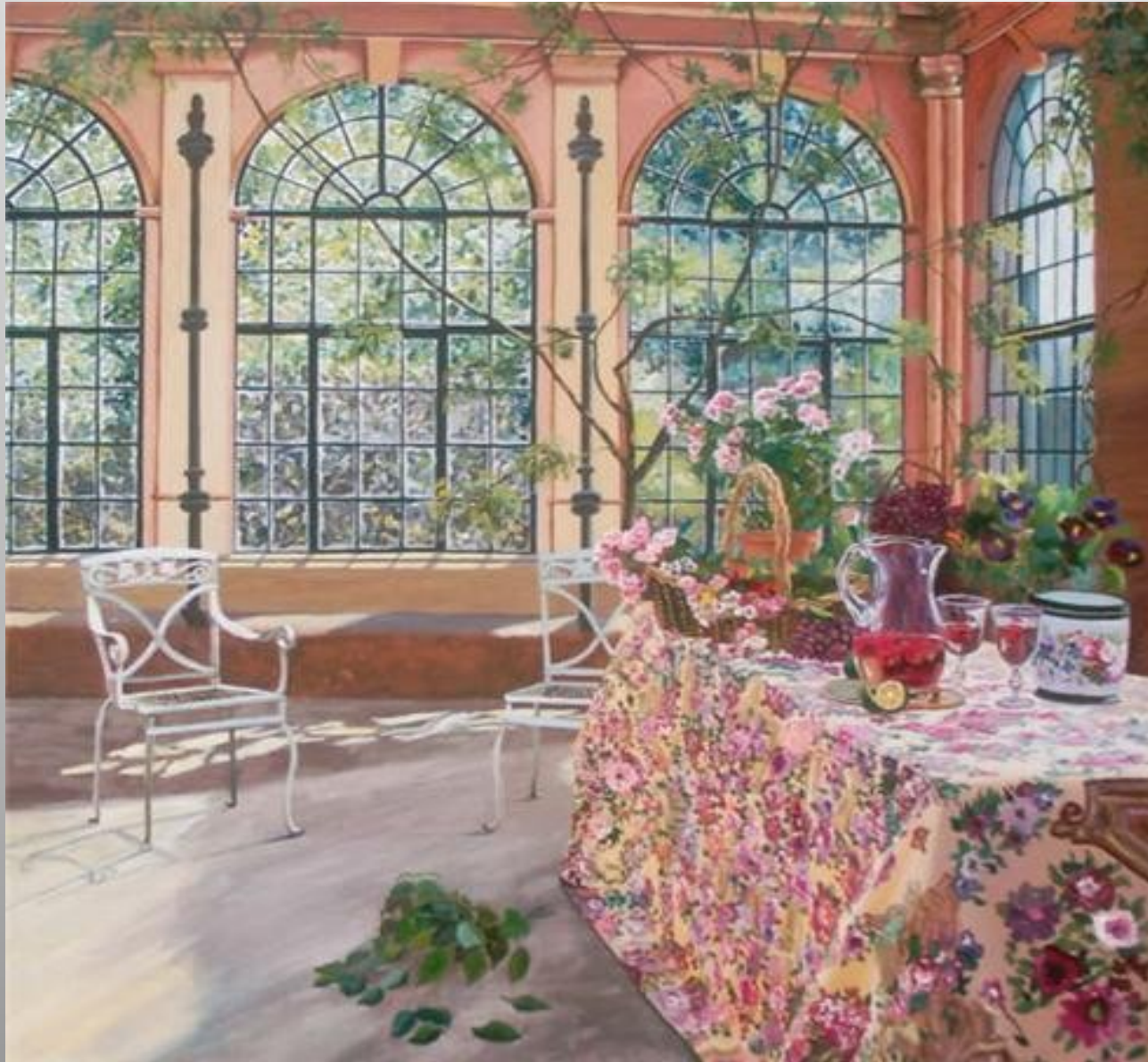
Hivernacle 100 x 100 óleo s/t.