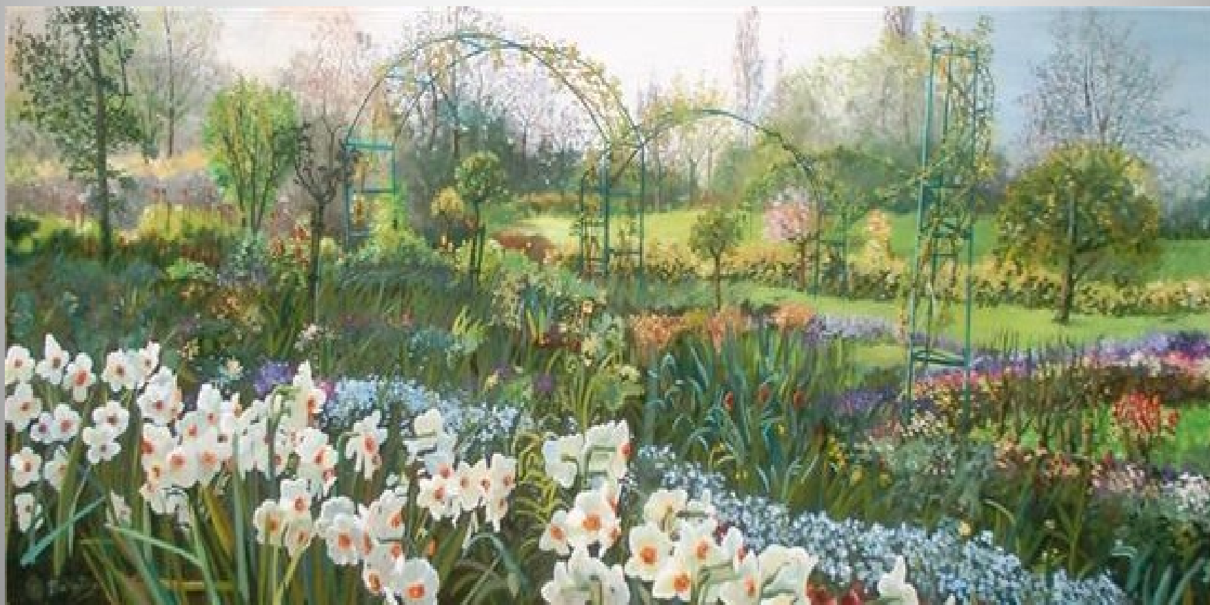
Neix la llum 116 x 50 óleo s/t.