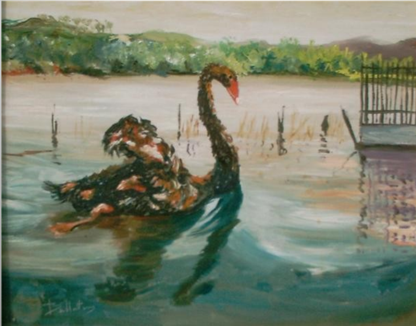
Cigne 27 x 22 óleo s/t.