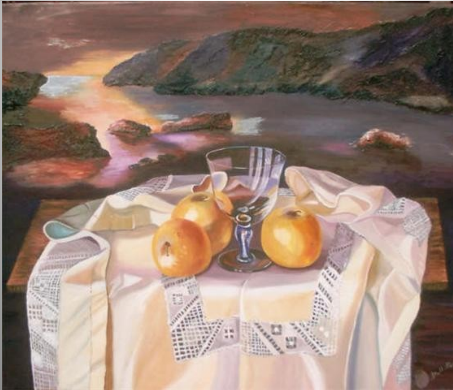
Mar i pomes 65 x 54 óleo s/t.